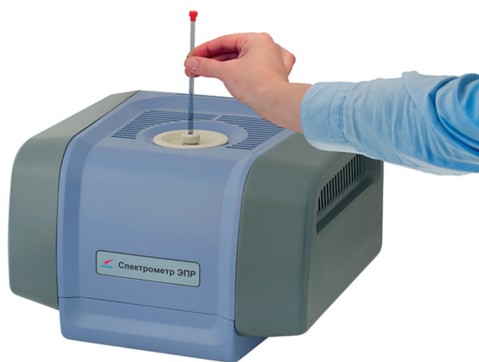
Figure 1. Appearance of the EPR spectrometer Рис. 1. Внешний вид спектрометра ЭПР

General technical characteristics of the EPR spectrometer are given in Table 1.